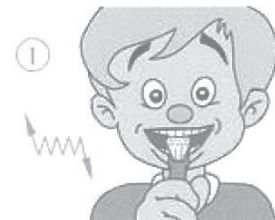
Schwupp und weg mit dem Dreck