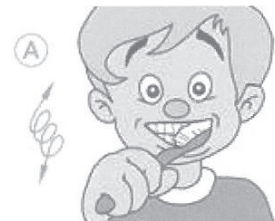
Kleine Kreise rundherum